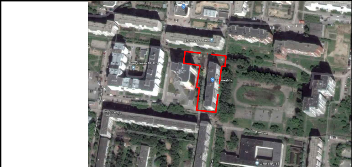
Экспликация зданий и сооружений